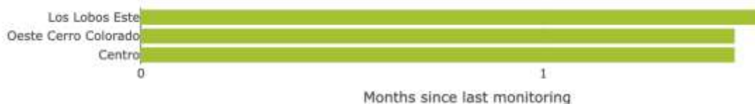
Figura 3. Calendario de monitoreo de la isla Plaza Sur en los tres sitios de estudio.